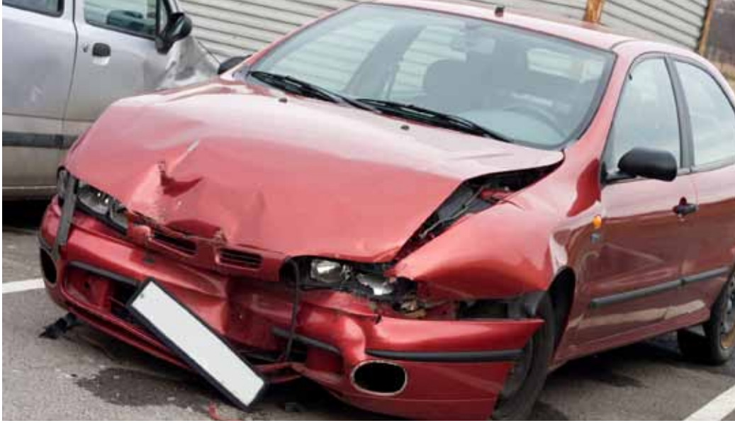
BBB samarbeider nå med Parkeringsetaten i Bergen kommune for å bli kvitt avskiltede bilvrak og feilparkerte biler på BBB sine områder