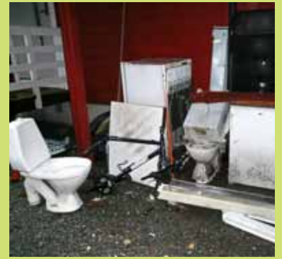
Slik så det ut før dugnadsgruppen trådte til.